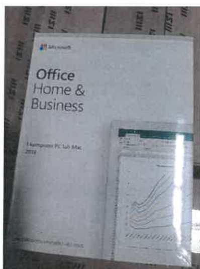
Rys. 3 Przykładowe zdjęcie pudełka dla produktu Microsoft Home&Business

Rys. 2 przykładowy kod zabezpieczony przez producenta systemu Microsoft Windows Office Home&Business z wymazanym, znajdującym się w prawym dolnym rogu numerem seryjnym produktu. Kod licencyjny znajduje się w środku szczelnie zapakowanego i zafoliowanego pudełka (Rys. 3)